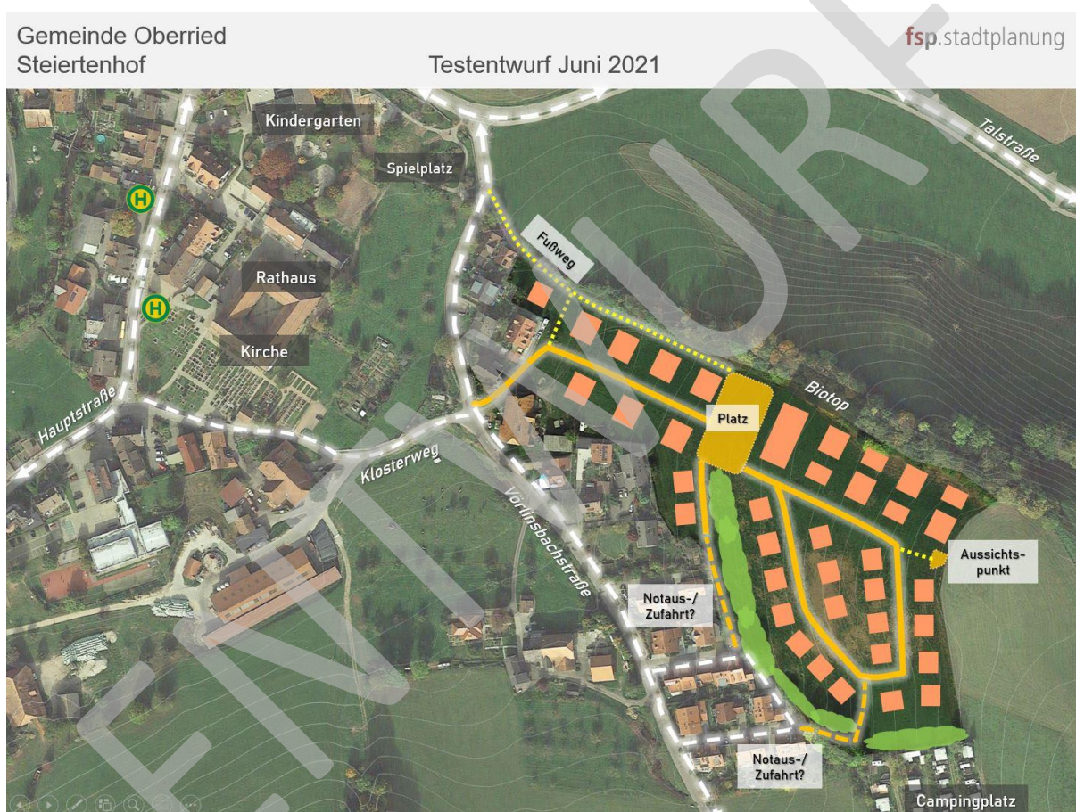
Abbildung 2: Der erste Testentwurf der fsp.stadtplanung zeigt die Zuwegung und einen möglichen Straßenverlauf im neuen Baugebiet. Orange hervorgehoben sind geplante Fahrstraßen, gelb gepunktet geplante Fußwege.

Die Erschließung ist im Bereich des bestehenden Steiertenhofs geplant. Eine zweite Erschließungsmöglichkeit über den Bruckmattenweg oder den Schwörerhofweg wurde geprüft und verworfen. Im ersten Entwurf ist hier eine Not-Zufahrt/-ausfahrt geplant. Die folgende Abbildung veranschaulicht einen technisch umsetzbaren Entwurf für den Straßenraum: